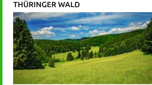
UNESCO-BIOSPHÄRENRESERVAT THÜRINGER WALD

Blütenreiche Bergwiesen, ausgedehnte Misch- und Nadelwälder, sprudelnde Bergbäche, fjordähnliche Wasserlandschaften und atemberaubende Aussichten machen den Thüringer Wald zu einem einzigartigen Naturerlebnis. Der Rennsteig verbindet gleich drei Nationale Naturlandschaften sowie zwei Geopark miteinander, in denen facettenreiche Begegnungen mit der Natur zu unvergesslichen Erinnerungen werden.